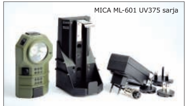
MICA ML-601 UV375 sarja

ML-601 UV375 käsivalaisimen toiminnot: 1W suurteho-LED seitsemän tunnin paloajalla, ympäristöystävällinen NiMH akku, EM turvavalotoiminto, syväpurkauksen esto, MIL-vihreä kuori ja 12 kappaletta 375Nm LEDiä.